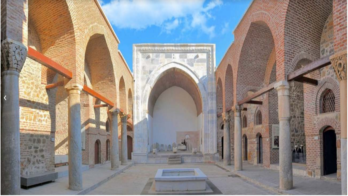
Ek 3: Akşehir Taş Medrese'nin (Taş Eserleri Müzesi) restorasyon sonrası görünümü 119