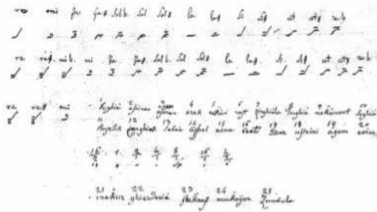
Fotoğraf 4. Guiseppe Donizetti'nin Batı müziği notasyon sistemiyle Hamparsum sistemini karşılaştırmalı gösteren çizelge