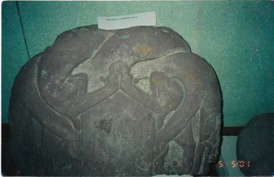
Fotoğraf 2: Ak-Beşim'den Burana Müzesi'ne getirilen Çift Başlı (simetrik) Bozkurt Motifli Kitabe Başlığı