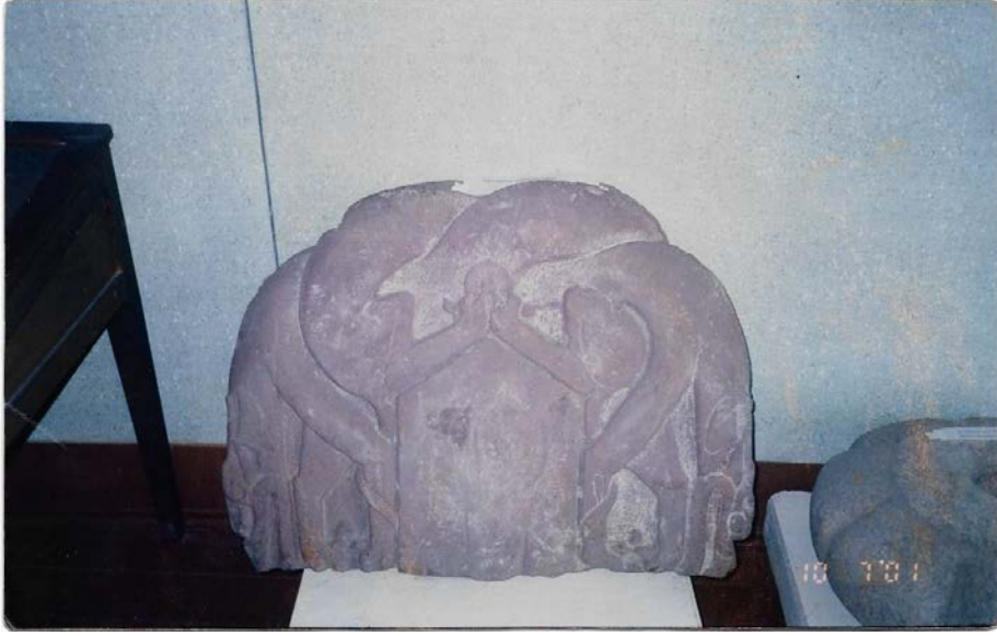
Fotoğraf 1: Ak-Beşim'den Burana Müzesi'ne getirilen Çift Başlı (simetrik) Bozkurt Motifli Kitabe Başlığı