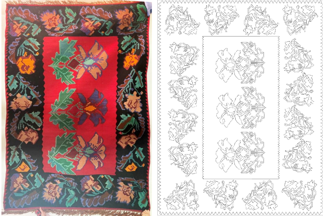
Görsel 14 - Kilim Örneđi 10 46 ve Yüzey Alan Şeması Çizimi 47