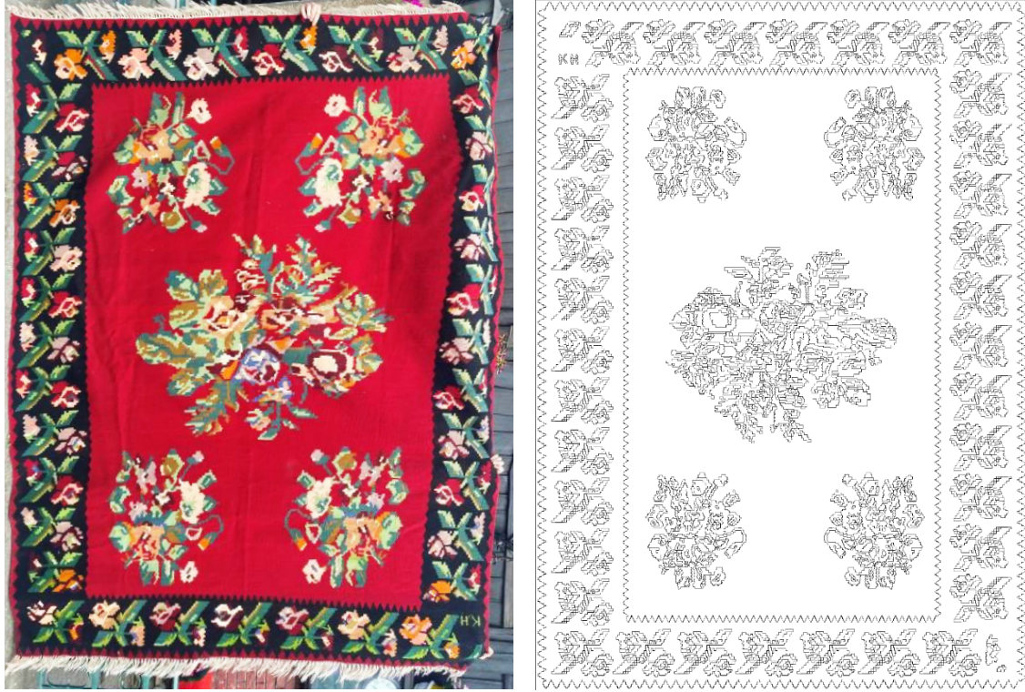
Görsel 11 - Kilim Örneđi 7 40 ve Yüzey Alan Şeması Çizimi 41