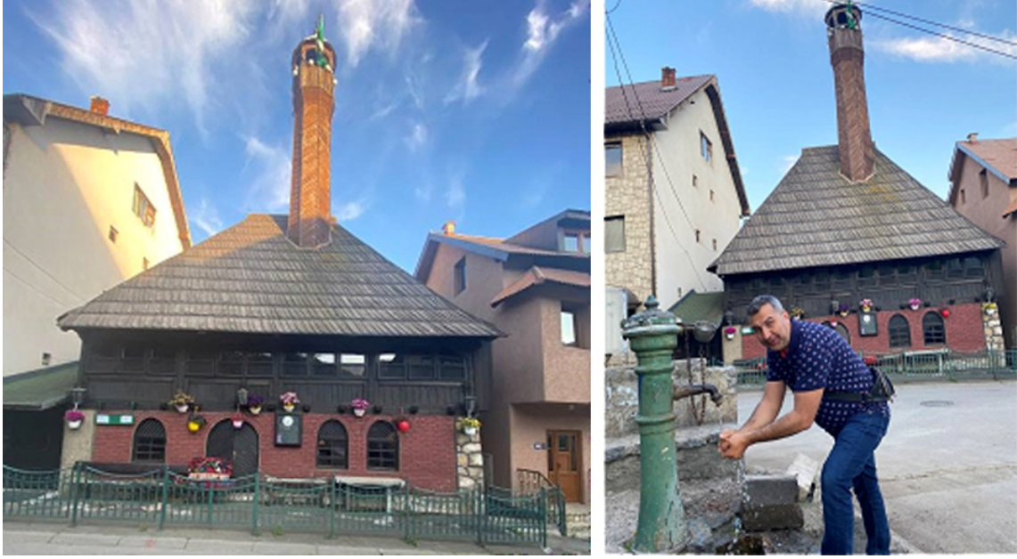
Görsel 2 - Kućanska Camisi 18