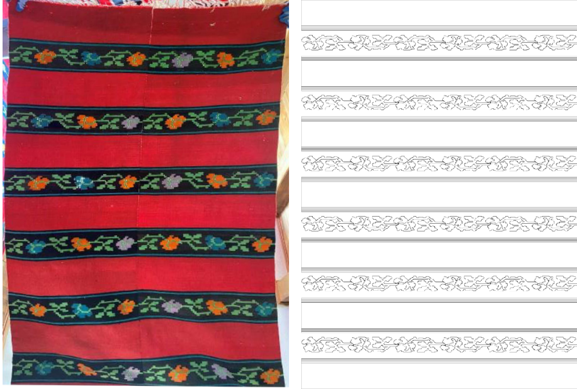
Görsel 7 - Kilim Örneđi 3 32 ve Yüzey Alan Şeması Çizimi 33