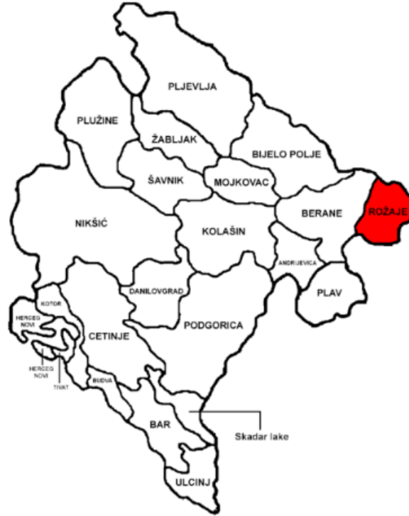
Görsel 1 - Karadađ Haritası 9

Günümüzde Balkan Yarımadası'nın batısında yer alan Karadađ'ın, kuzeybatısında ve kuzeyinde Bosna Hersek, kuzeydoğusunda Sırbistan, doğusunda Kosova, güneyinde Arnavutluk ve batısında ise Hırvatistan yer almaktadır.