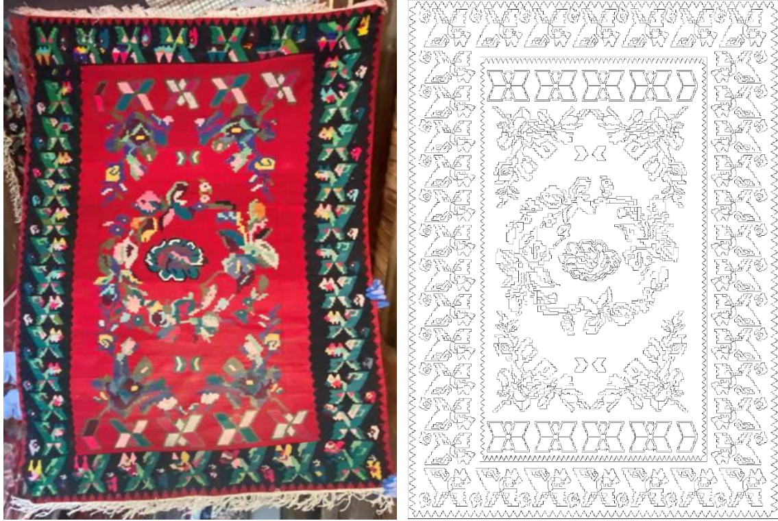
Görsel 12 - Kilim Örneđi 8 42 ve Yüzey Alan Şeması Çizimi 43