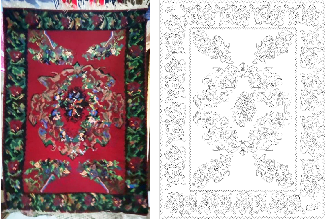
Görsel 13 - Kilim Örneđi 9 44 ve Yüzey Alan Şeması Çizimi 45