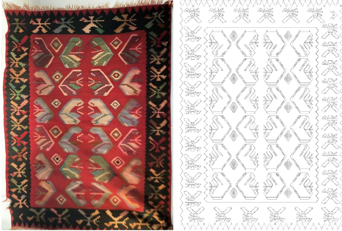
Görsel 8 - Kilim Örneđi 4 34 ve Yüzey Alan Şeması Çizimi 35