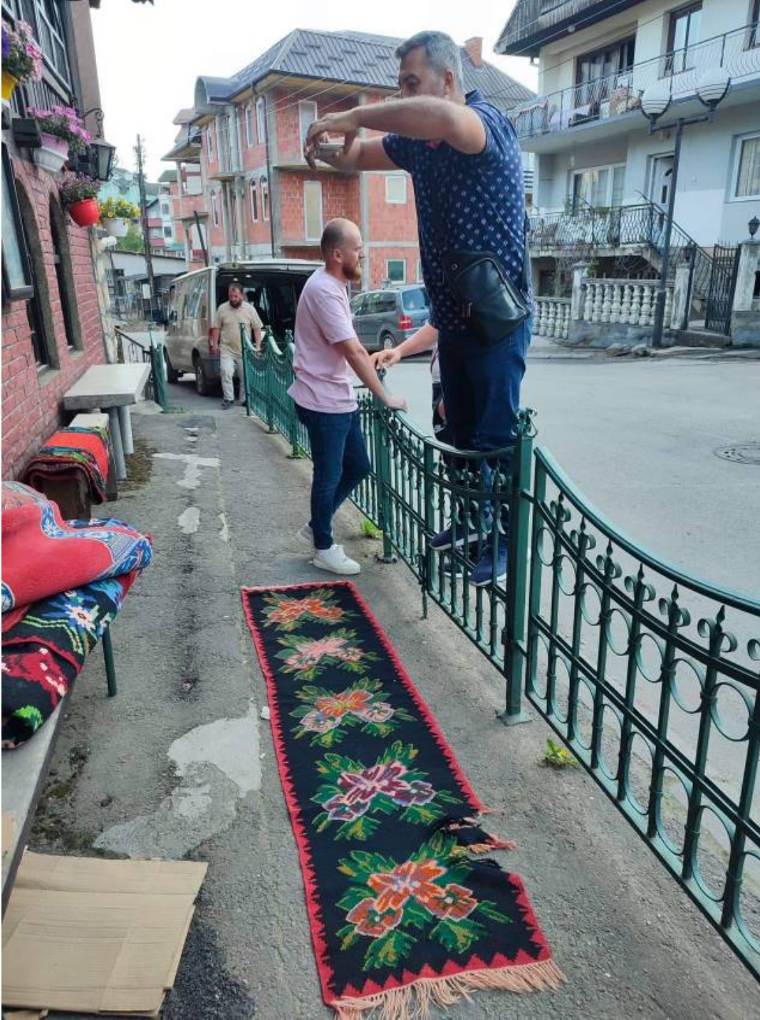
Görsel 4 - Rođaje Kućanska Cami Kilimleri Alan Arařtırması 27

Arařtırma esnasında tespit edilen bu dokumalar yörenin karakteristik özelliklerini barındıran örnekler arasında yer almaktadır. Balkan ve Bořnak kültürünü yansıtan 15 adet kilim, 1 adet yolluk, 4 adet halı seccade dokuma örneğine rastlanmıřtır. Bu örnekler fotođraflanarak kataloglanmıřtır. Bu makalede 10 adet kilim örneđi; desen, renk, kompozisyon, dokuma tekniđi ve hammadde özelliklerine göre incelenmiřtir.