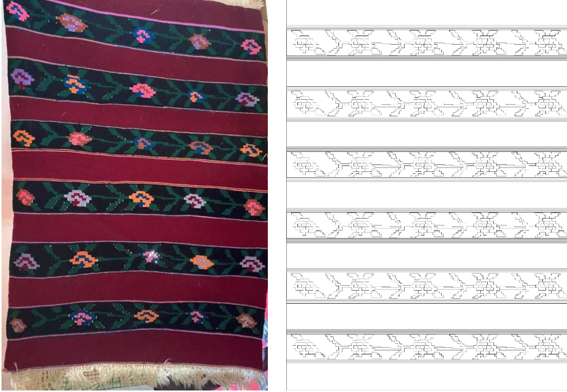
Görsel 5 - Kilim Örneđi 1 28 ve Yüzey Alan Şeması Çizimi 29