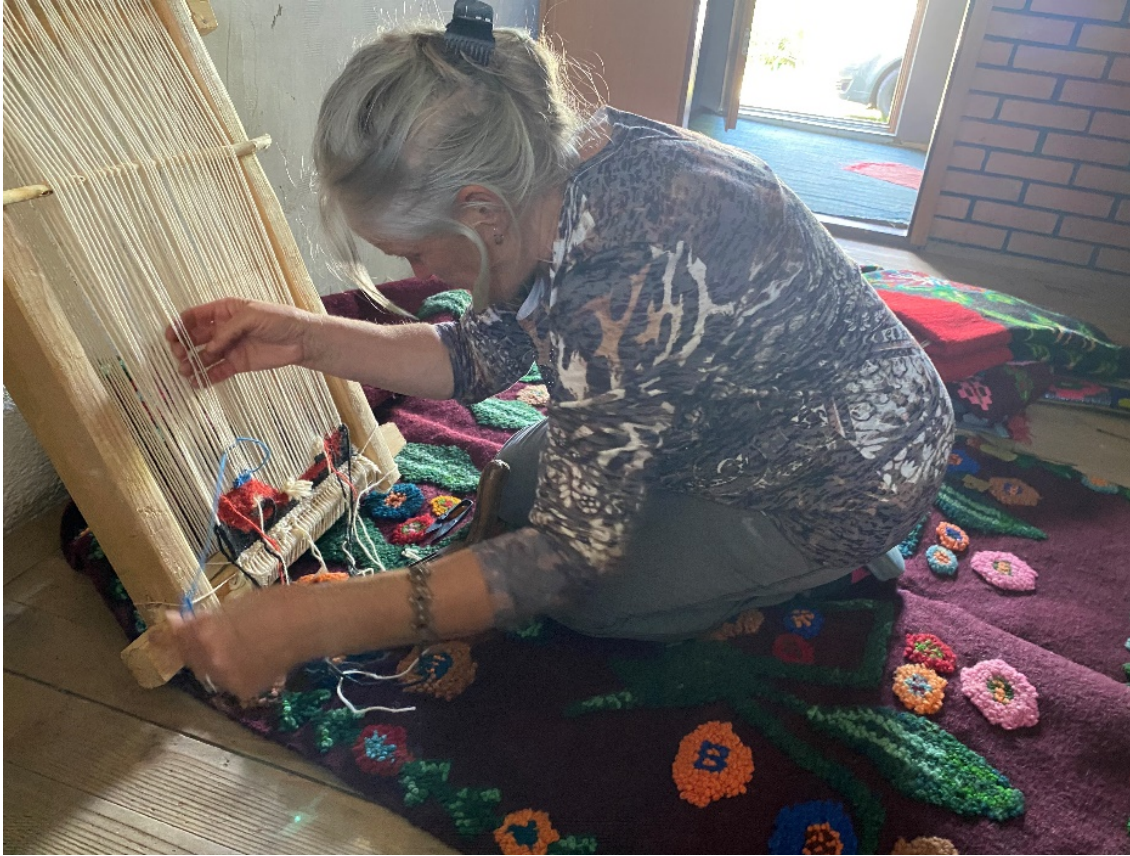
Görsel 3 - Boşnak Kadını Halı Dokurken 21

Özellikle Bosna Hersek'ten Anadolu'ya gelenler dokuma kültürlerini yerleştikleri Adana, Manisa, Balıkesir, Sakarya, Edirne, İzmit, Bursa, Amasya, Erzincan, Sivas, Samsun gibi şehirlerde de devam ettirmektedirler. 22 Bu bölgelerdeki köylerde bulunan dokuma örneklerine bakıldığı zaman, Boşnak kültürünün dokuma izlerine rastlanmaktadır. Bu sebeple Anadolu ve Balkan dokuma kültüründe benzerliklerin görülmesi de doğaldır. Bir zamanlar Osmanlı toprağı olan Karadađ / Rođaje şehrinde bulunan Kučanska Camisi'nde de bu el dokuması halı ve kilimlere rastlanmaktadır.