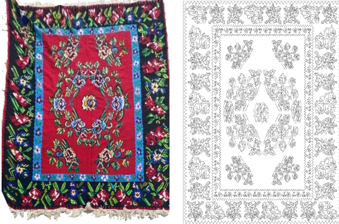
Görsel 10 - Kilim Örneđi 6 38 ve Yüzey Alan Şeması Çizimi 39