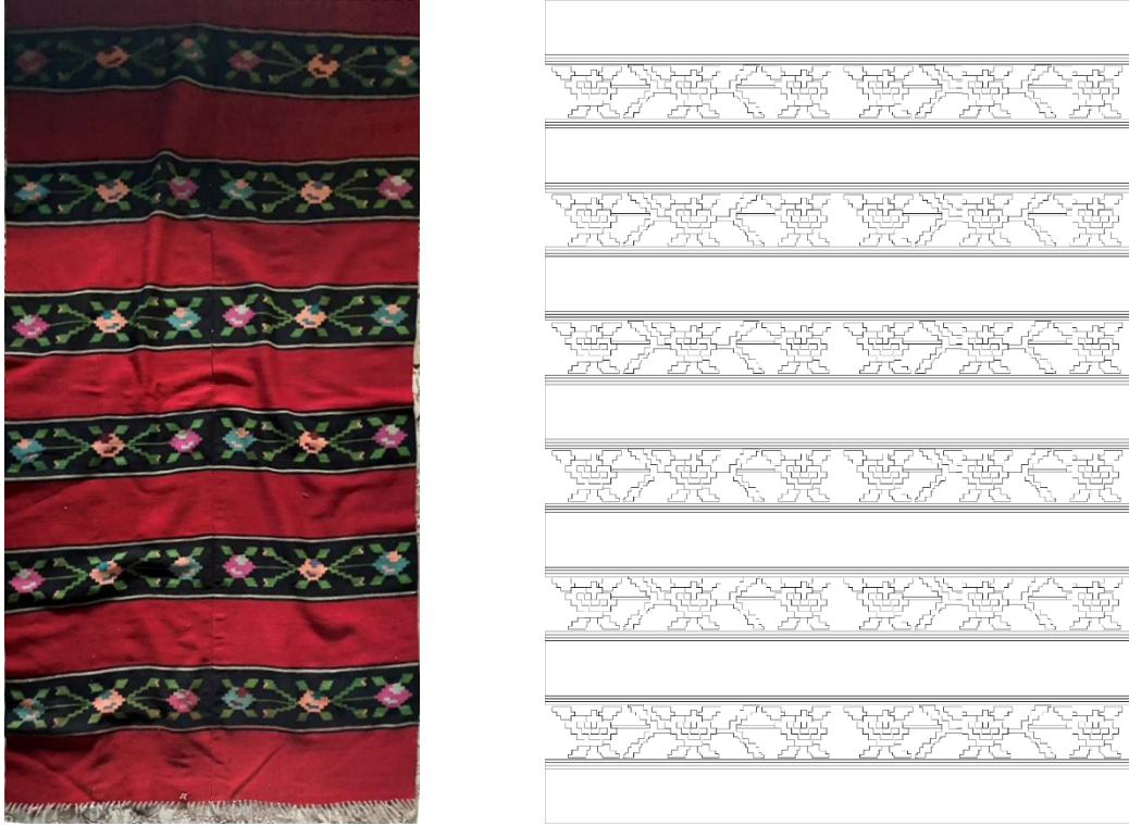
Görsel 6 - Kilim Örneđi 2 30 ve Yüzey Alan Şeması Çizimi 31