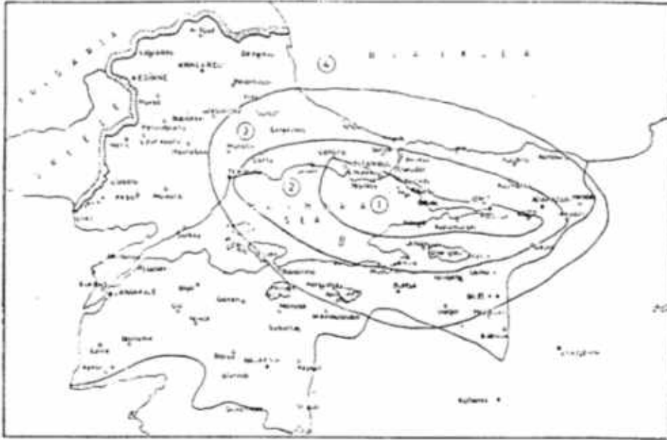
Şekil 1: 1894 İstanbul Depremi’nin etki alanını gösteren harita (Oğuz Gündoğdu’dan)