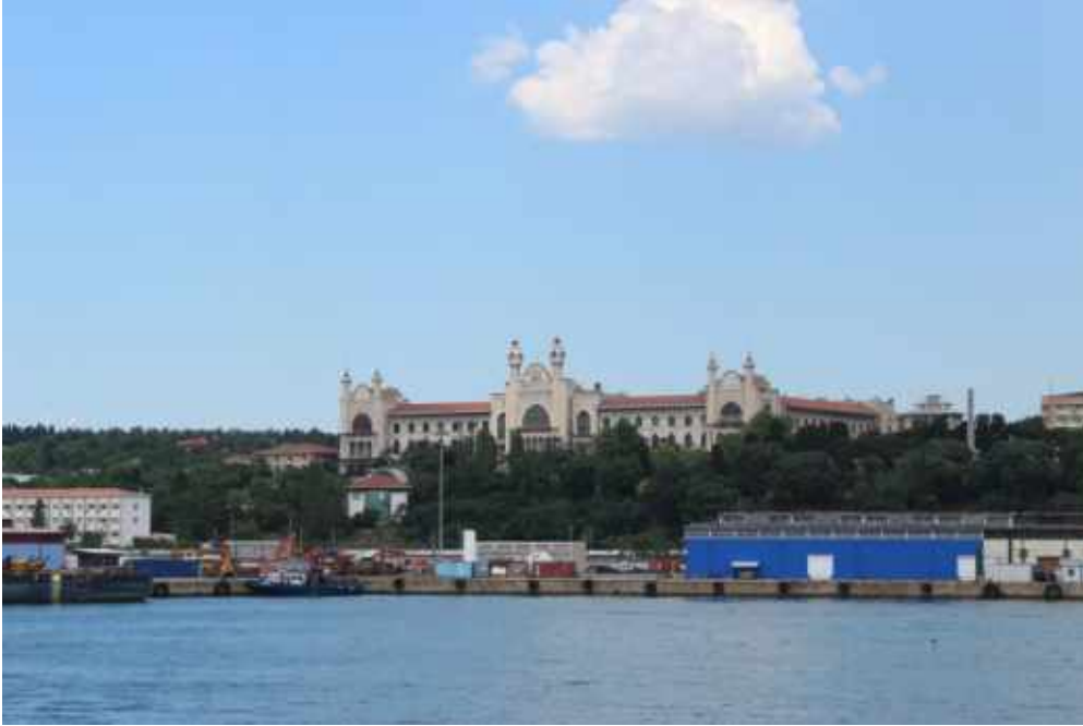
Şekil 3: Binanın deniz cephesi (Haziran 2015)