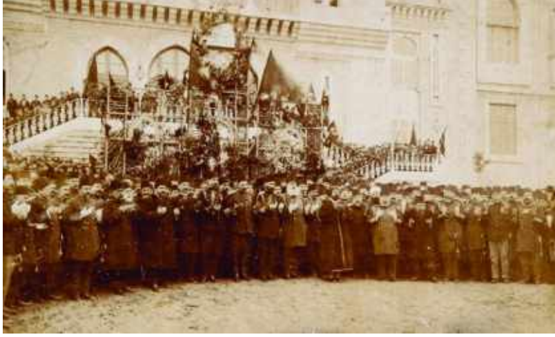
Şekil 6: Haydarpaşa Mekteb-i Tıbbiye binasının açılış töreni