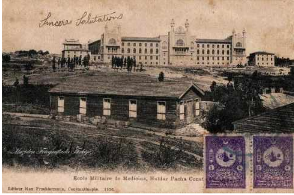
Şekil 2: Binanın yapıldığı yıllarda deniz cephesini gösteren eski bir kartpostal