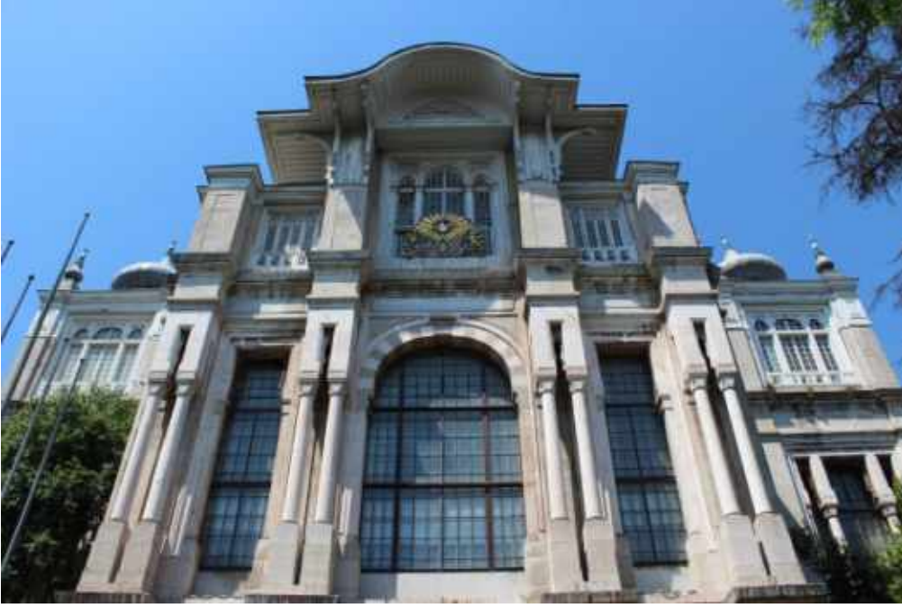
Şekil 4: Binanın kara cephesi, giriş detayı (Haziran 2015)