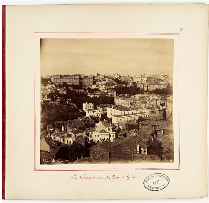
EK-2. Galata Kulesi'nden Beyoğlu'nun Görünüşü ( II. Abdülhamid Han Fotoğraf Albümleri ).