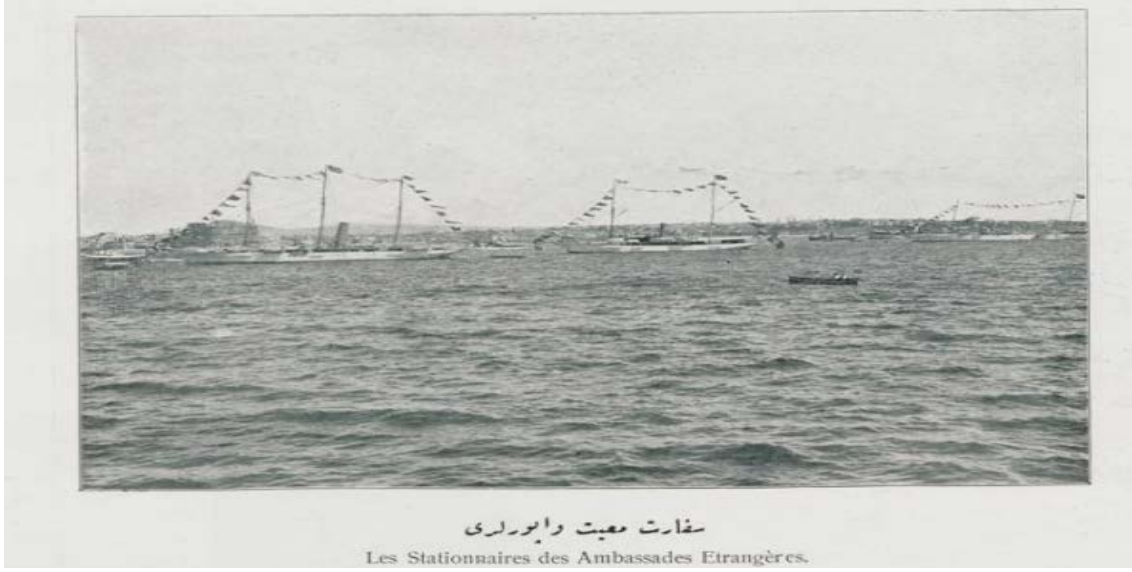
EK-1. Sefaret Maiyet Vapurları ( Şehbal , S. 25, 28 Ağustos 1910, s. 6).