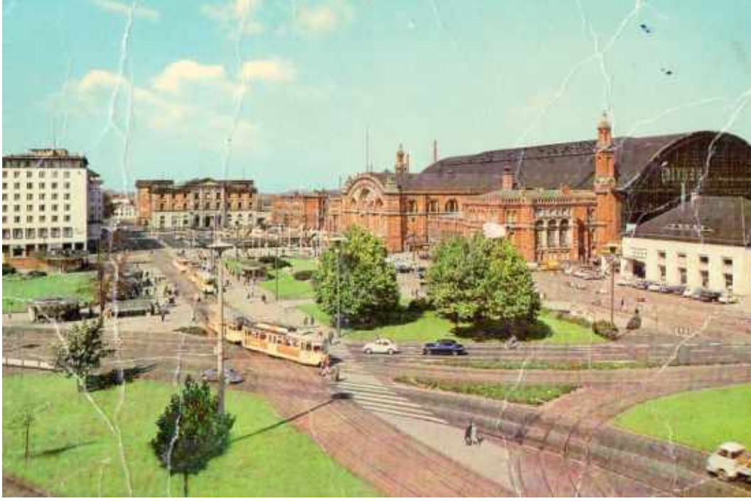
Resim 3: Binlerce Türk'ün ve Selime Afet'in kaderini değiştiren Bremen Tren İstasyonu (1966)

aldi. Yemek yedik. Yugoslavya'dan Avusturya üzerinden Almanya'ya... Pazartesi (3 Ekim 1966) saat 10'da Münih'te indik. Orada kahvaltı yaptık. Biraz dinlendikten sonra 5'te (17.00) Bremen trenine bindik. 11'de (23.00) Bremen'e geldik. 5 (Bremen'de işveren elinde isim yazılı bir pankartla onları karşılıyor.) Oradan patronun arabasıyla 12'de (24.00) Dünsen'e geldik. 1'de (01.00-4 Ekim 1966 Salı) yattım. 6'da kalktım. 1 mektup yazdım. 10.30'da patron geldi beni fabrikaya götürdü. 11'de işbaşı yaptım. Salı günü idi."