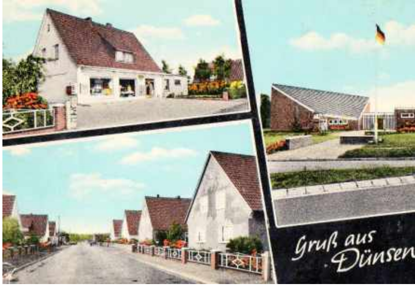
Resim 4: Selime Afet'in kaldığı evin bulunduğu cadde ve fabrikanın girişi (1967).